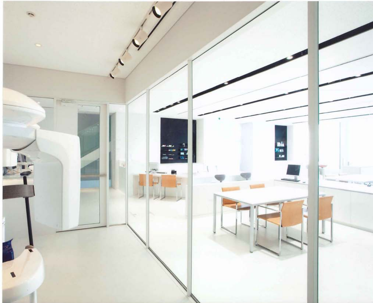
レントゲン室からショールームを臨む：最小部材によるサッシュと透明感の高いガラスにより最大限の開放性を実現