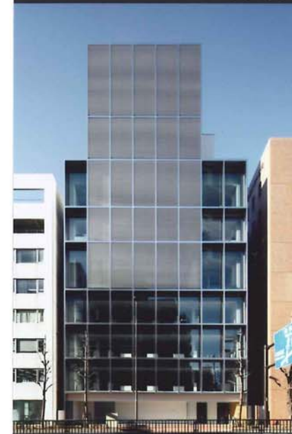
GC Corporate Center 外観