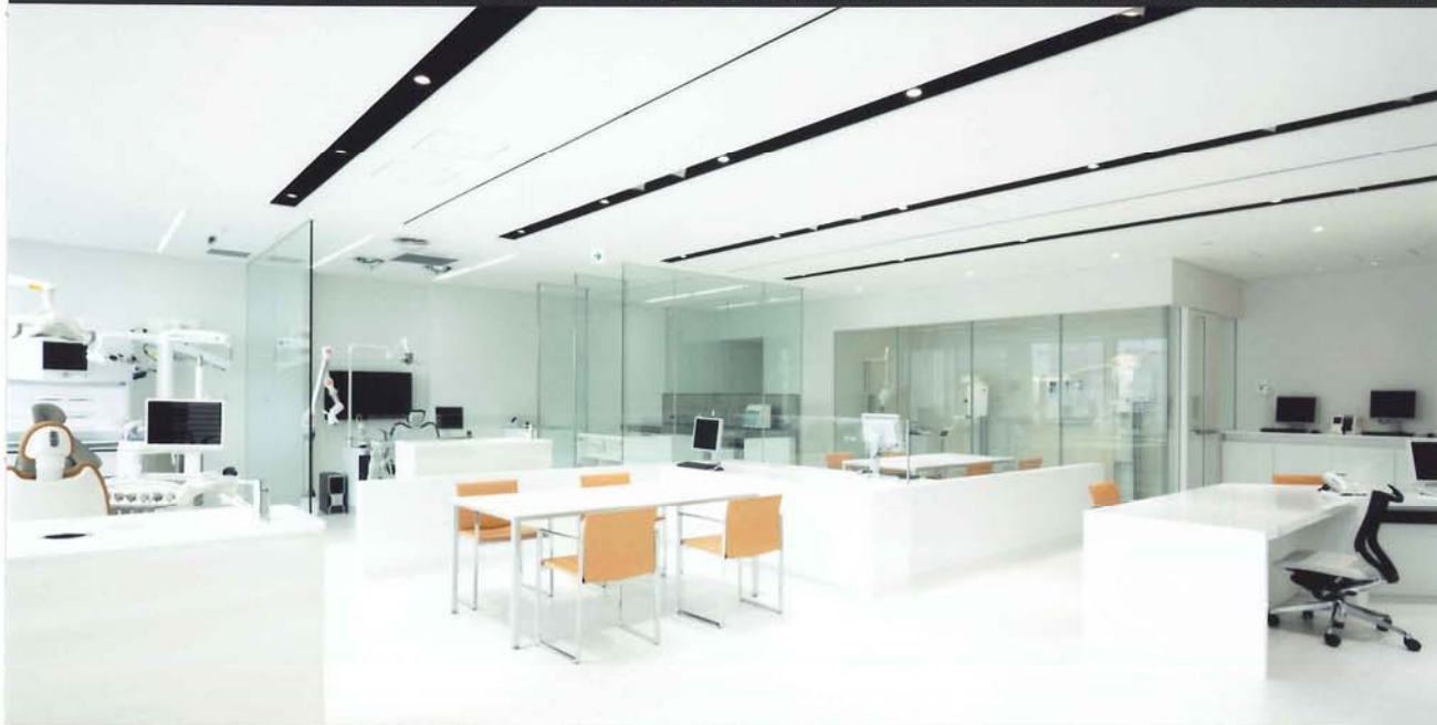
ショールーム全景 奥がレントゲン室

コメント 創業90周年を迎える歯科医療総合メーカー「ジーシー」の本社ビルに併設された、お客様とのコミュニケーションの新拠点「GC Corporate Center」内のショールームでは最新のCT撮影装置やエックス線の撮影装置が置かれ、実際の診療を体感できるデモ撮影が可能である。放射線遮蔽区画には鉛ガラスの両面に特殊カバーガラスを合わせた「LXプレミアム」を採用。遮蔽区画を成立させる最小の部材によるサッシュディテールの造りこみにより、これまでのレントゲン室のイメージを一新する開放感を実現した。