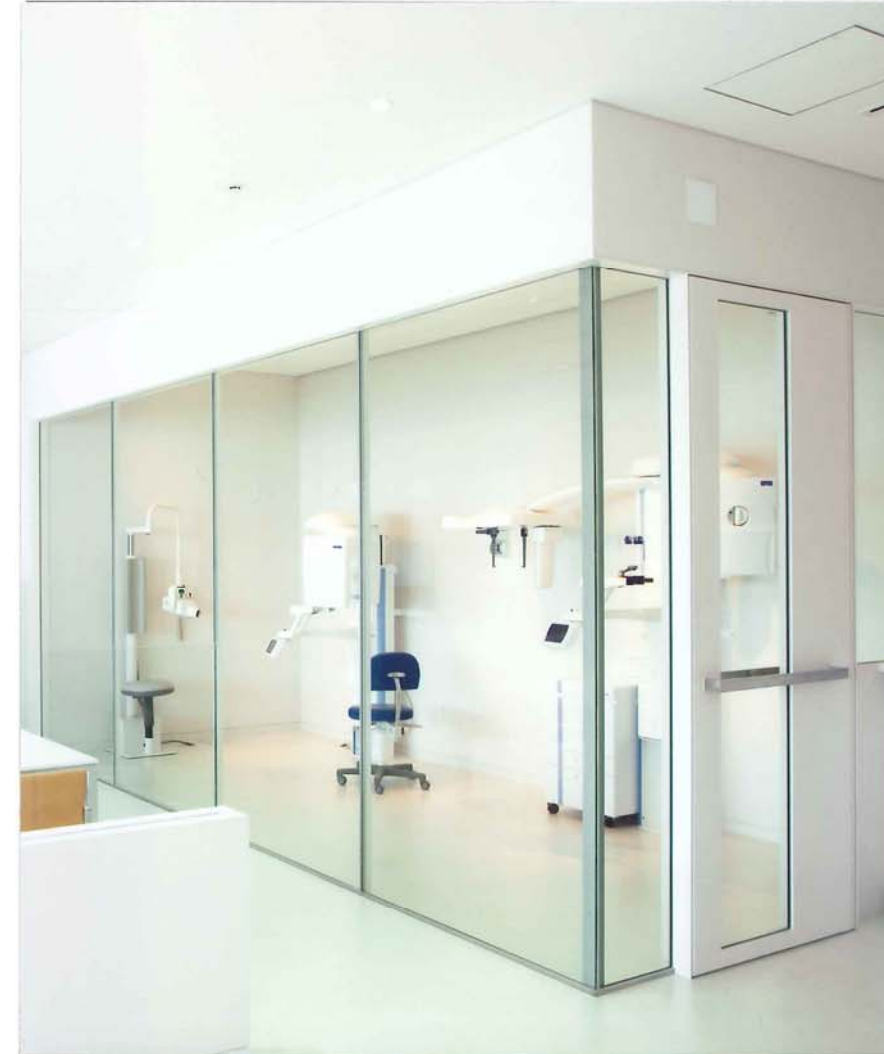
レントゲン室全景：最小寸法部材によるサッシュ及び構築建具

コメント 創業90周年を迎える歯科医療総合メーカー「ジーシー」の本社ビルに併設された、お客様とのコミュニケーションの新拠点「GC Corporate Center」内のショールームでは最新のCT撮影装置やエックス線の撮影装置が置かれ、実際の診療を体感できるデモ撮影が可能である。放射線遮蔽区画には鉛ガラスの両面に特殊カバーガラスを合わせた「LXプレミアム」を採用。遮蔽区画を成立させる最小の部材によるサッシュディテールの造りこみにより、これまでのレントゲン室のイメージを一新する開放感を実現した。