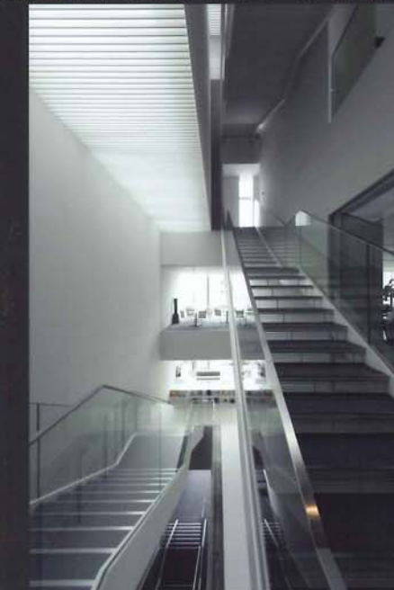
ショールームスペースを繋ぐ内部階段

創業 90 周年を迎える歯科医療総合メーカー「ジーシー」の本社ビルに併設された、お客様とのコミュニケーションの新拠点「GC Corporate Center」内のショールームでは最新の CT 撮影装置やエックス線の撮影装置が置かれ、実際の診療を体感できるデモ撮影が可能。放射線遮蔽区画には鉛ガラスの両面に特殊カバーガラスを合わせた「LX プレミアム」を採用。遮蔽区画を成立させる最小の部材によるサッシュディテールの造りこみにより、これまでのレントゲン室のイメージを一新する開放感を実現した。