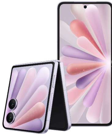
HONOR「Magic V Flip2」（本体内側のメインディスプレイに Dinorex UTG ® が採用）