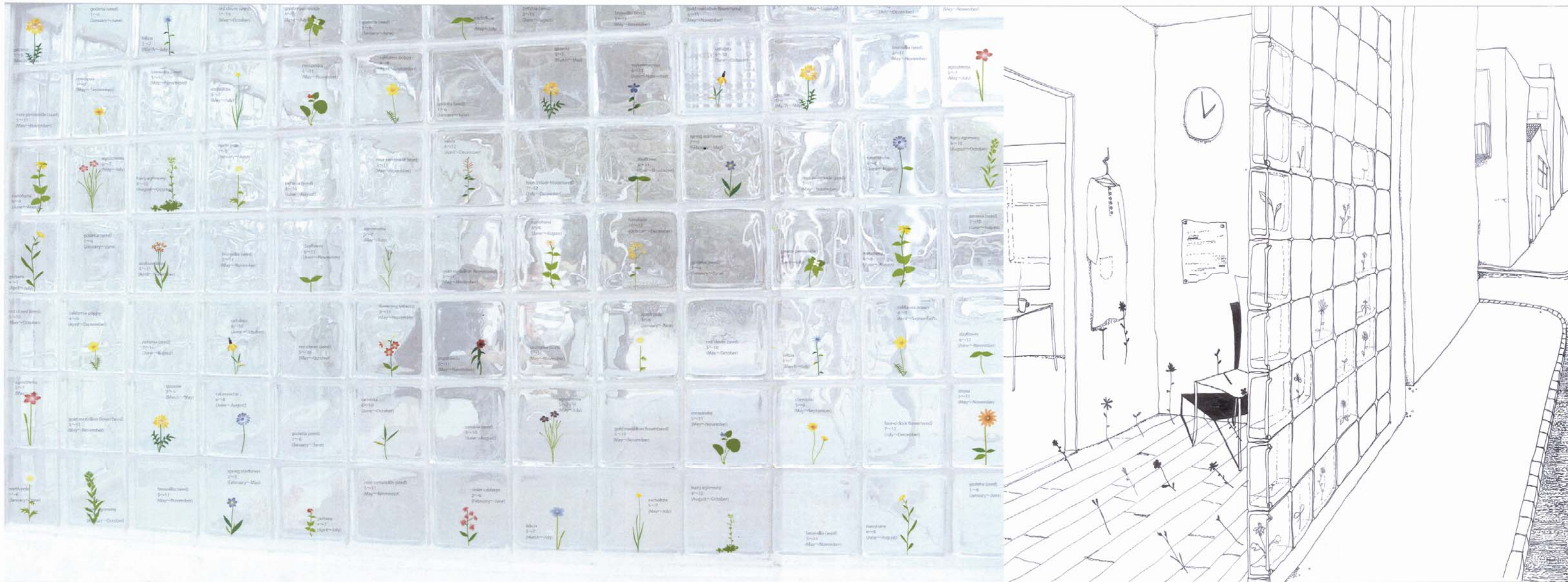
フローリングに落とし込まれる花の模様。 彼女の部屋の床では 影の公園がゆっくと時を刻む。