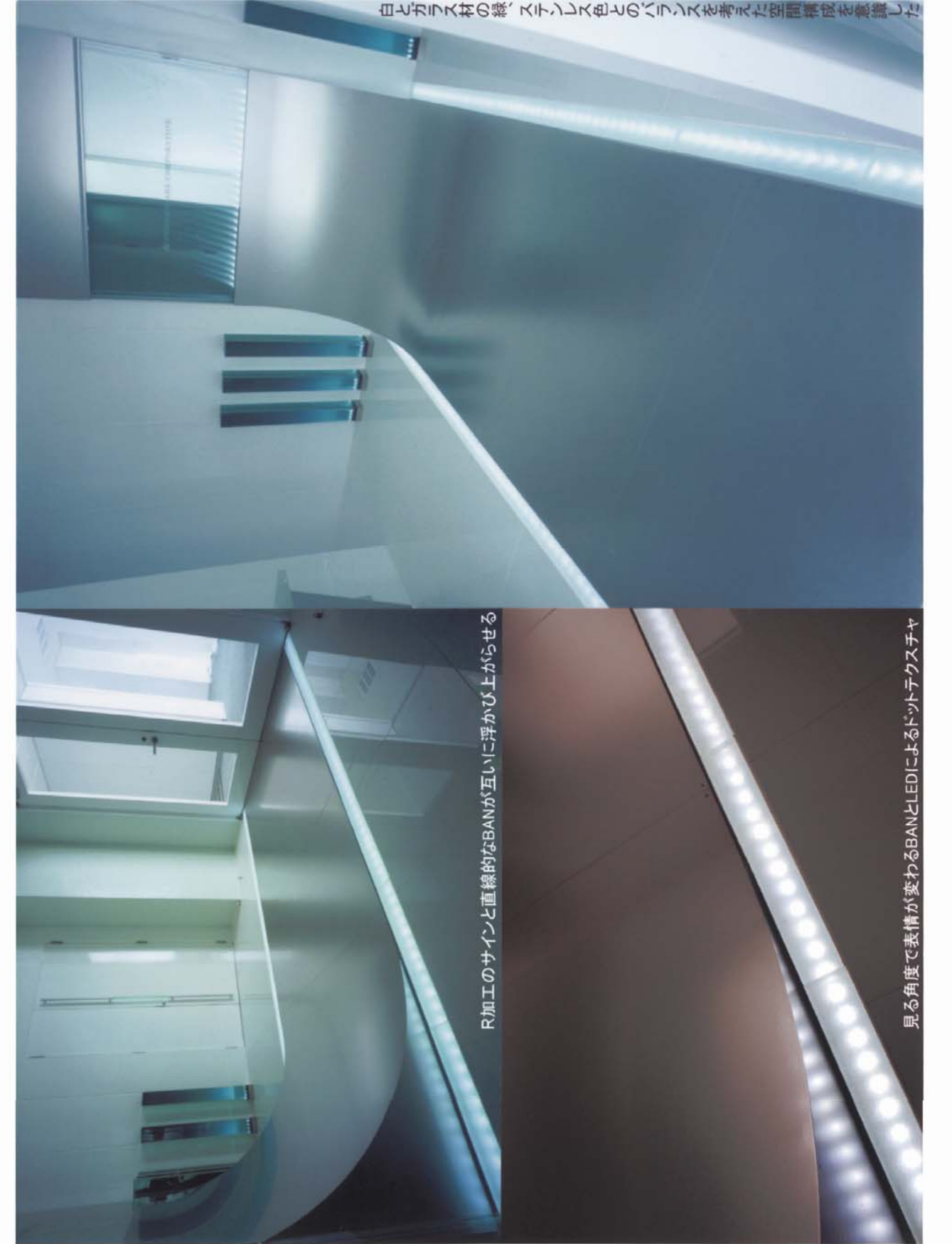
ステンレス色の線、白と黒の組み合わせによる空間構成を意識した

コメント 本件は、鋼材商社のエントランスホール。ステンレスブライプレーション仕上げによるRサインは鉄板のコイルを連想させる事を意識してデザインされた。その両サイドにはLEDと組み合わせられたグラソア「BAN」を配し、その直線的な形状によりRを引き立たせながら、見る角度によって光の見え方が変化するので様々な表情を生み出す、白色のパーツとガラス質の緑による空間に、ステンレス色のアクセントを加えることにより、シャープでありながら、寒々しくならないような配色とコントラストに配慮した、他では感じられない透明感のある空間を感じられることを期待したい。