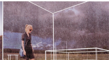
雨が降るとカーブが現れる