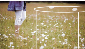
自然の中にテーブルの輪郭が浮かぶ