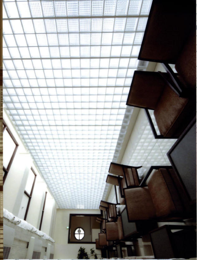
ガラスブロック内部に溜まった光があふれ出しまどろむような光景となる

コメント 約9000個のガラスブロックを用いたチャペル。トップライトの自然光が頂部のガラスブロックによって拡散され、チャペル内に充滿する。チャペル内の光景は側壁から回廊に溢れ出る光の量とのバランスによって定常状態となり、外部状況の変化に合わせた移ろいを持つ不思議な浮遊感を生み出す。