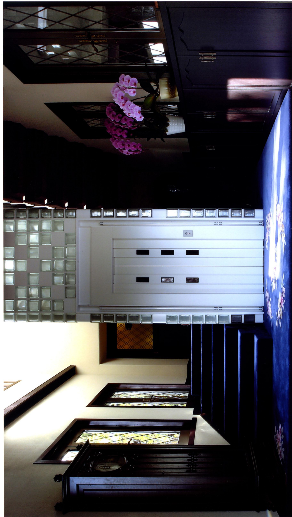
エントランスホールにガラスブロックとスチールによる自立するEVシャフトを設置する

コメント エントランスホールに自立するホームEVを設置した。EVシャフトの構造体をGBの目地内に納め、壁厚102mmの省スペース化を実現させた。GBと同サイズのS-PLを螺旋状に配置し、地震にも耐える自立した構造体を成立させた。シャフト内の照明により、ガラスブロックの光の筒がエントランスホールを演出する。