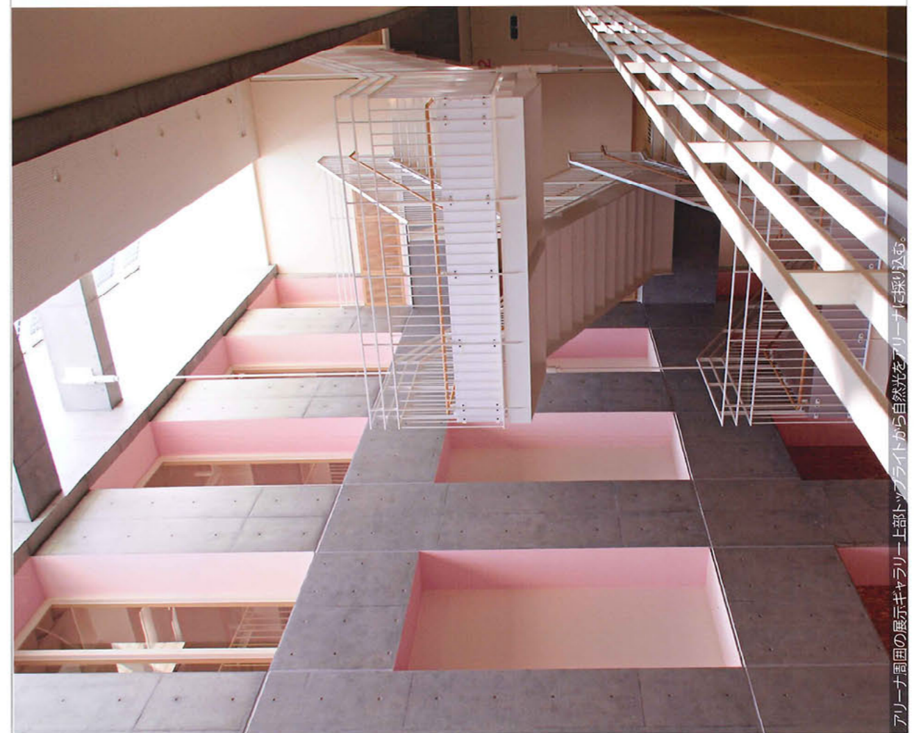
アリーナ周囲の展示ギャラリー上部トツファイアライトから自然光をアリーナに採り込む