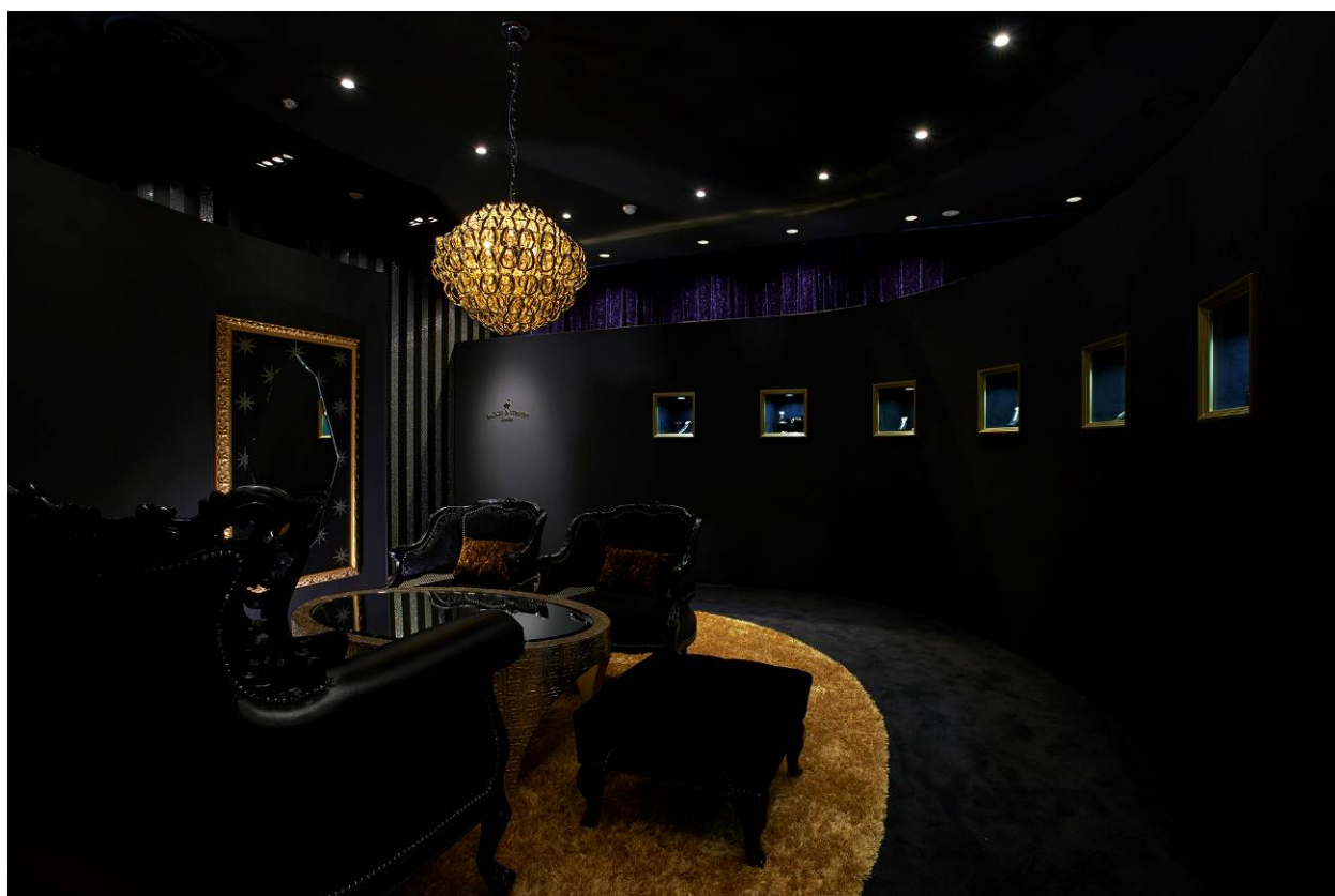
フランク・ミュラー ウォッチランド大阪「ボックス & ストラウス サロン」