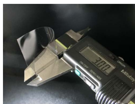
直径 3 mm (R1.5) の折り曲げが可能