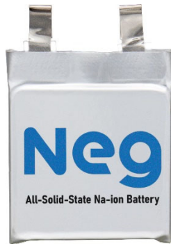
全固体ナトリウムイオン二次電池（標準サンプル）

日本電気硝子株式会社（本社：滋賀県大津市 社長：岸本暁）は、このたび全固体ナトリウムイオン二次電池（以下、NIB）のサンプル出荷を開始しました。